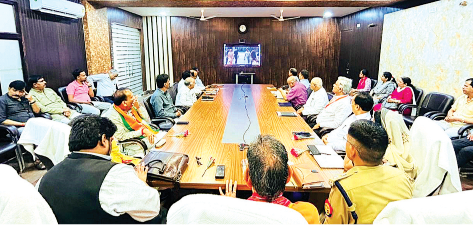
ललितपुर